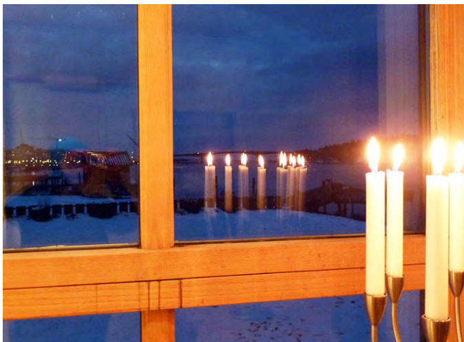
View gallery-window at Bh5

VARIA har bidragit till att höja statusen för scenkonstformen festivalen representerar... VARIA kommer in med en skön sorts energi som är vitaliserande... Festivalen är något annat än ett vanligt gästspel, dess olika delar skapar dynamik. Tomas Persson/Atalante