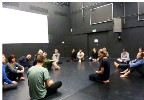
Educational Program, photo Lisa Larsdotter Petersson